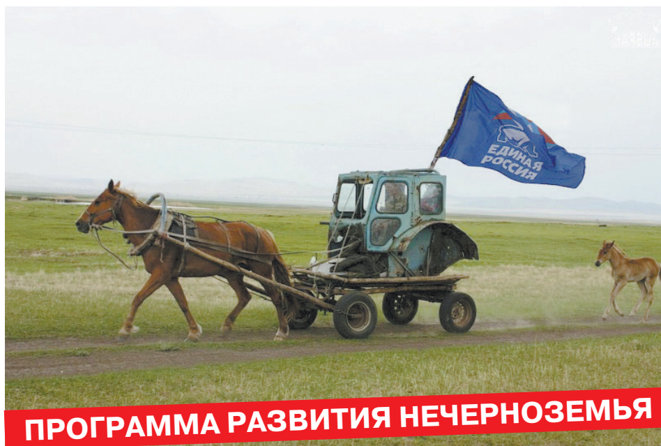
ПРОГРАММА РАЗВИТИЯ НЕЧЕРНОЗЕМЬЯ

За примерами далеко ходить не надо. Достаточно лишь бегло пробежаться по итогам инспекционных поездок ОНФ, чтобы понять: большинство предвыборных проектов «ЕР» - не более чем «пшик», граничащий с преступной