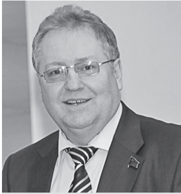
Сергей ОБУХОВ, депутат Государственной Думы, член Президиума, секретарь ЦК КПРФ