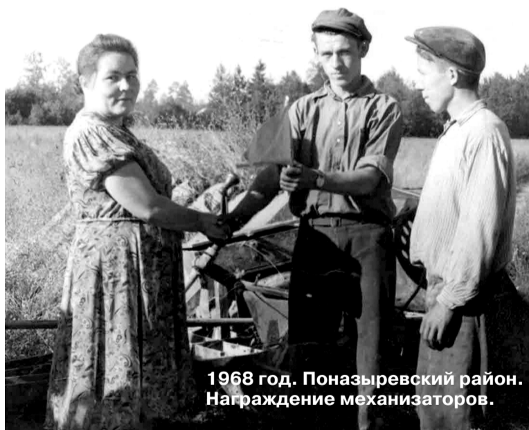
1968 год. Поназыревский район. Награждение механизаторов.

— Да. Изменения произошли для того, чтобы оперативней руководить регионами и динамичней поднимать экономику. А она была разрушена войной.