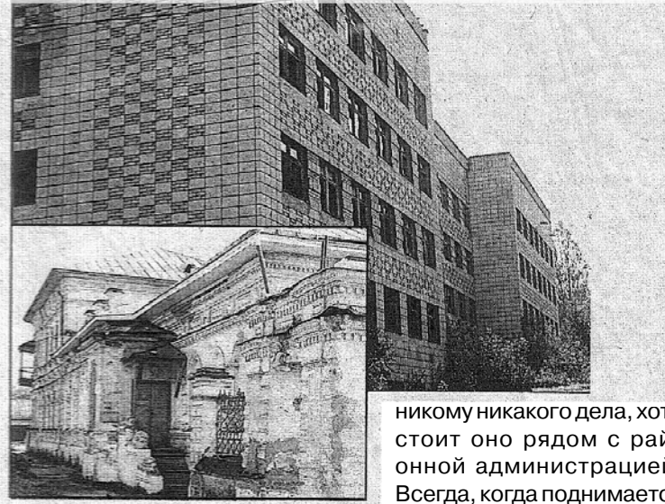
Новое и старое здания Судиславской районной больницы

глубокие трещины, перекрытия нуждаются в укреплении и так далее.