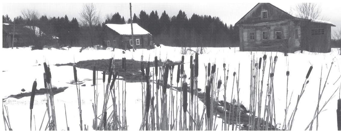
Село превращается в болото