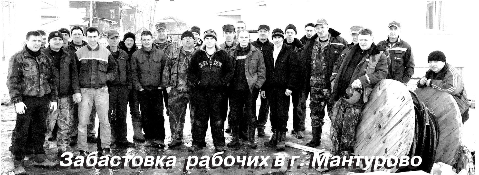
Забастовка рабочих в г. Мантурово

18 марта. Рабочий день. На строительной площадке домов, возводимых по федеральной программе «Переселение из ветхого жилья», на улице Октябрьской в городе Мантурово – забастовка рабочих. Тридцать пять наемных работников, доведенных до отчаяния отсутствием заработной платы в течение четырех месяцев, отказались приступить к работе и устроили сидячую забастовку.