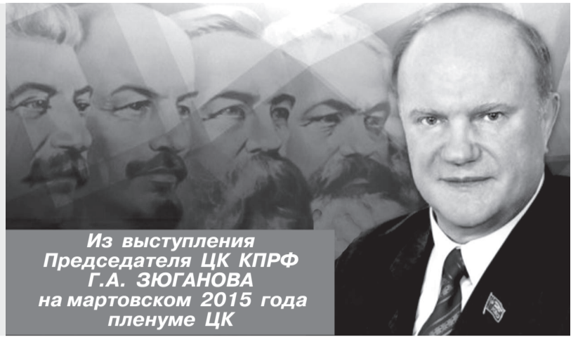
Из выступления Председателя ЦК КПРФ Г.А. ЗЮГАНОВА на мартовском 2015 года пленуме ЦК