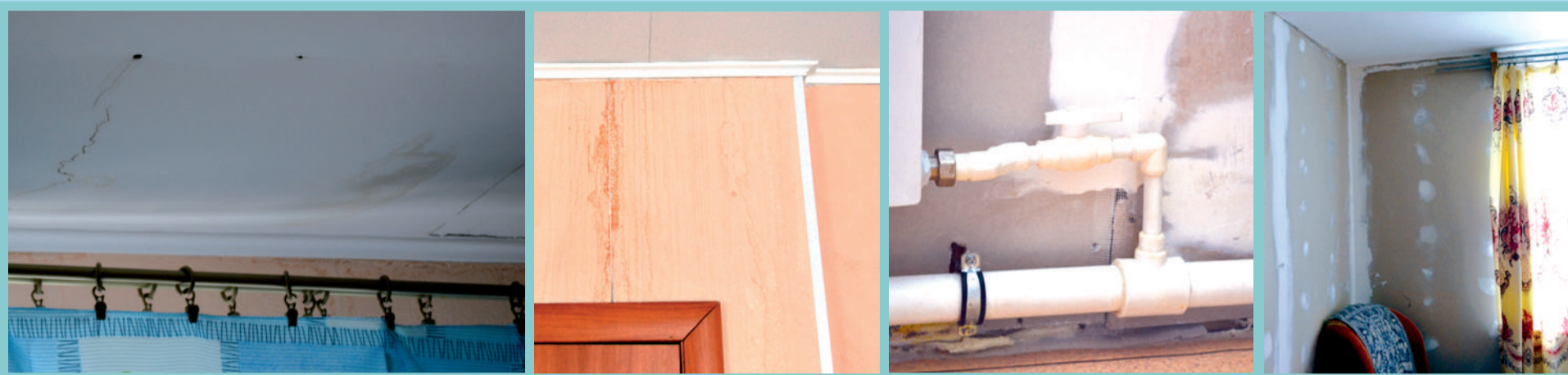
Изнутри новенький дом расходится по швам, как плохонькие китайские брюки...

тий положили сначала бруски 45x45 мм, на них — фанеру, — рассказывает она. — А на нее положили линолеум. Фанера прогнулась, и весь линолеум пошел пузырями. Пол в комнате перекосяило. Под мебель приходится подкладывать чурки. Двери тоже перекосяло. И с окнами проблема, как у остальных. Отверстия между стеной и оконной коробкой не запенены. Все тепло из квартиры выдувает.