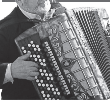
АГИТБРИГАДА КОСТРОМСКОГО ГОРКОМА КПРФ ПОЗДРАВИЛА ВЕТЕРАНОВ ОДНОГО ИЗ МИКРОРАЙОНОВ ГОРОДА С ДНЁМ ПОБЕДЫ.