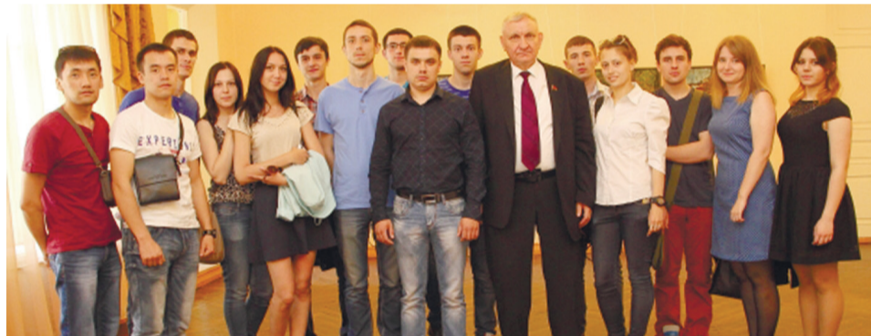
Студенты Каравеевской сельхозакадемии отпросились с занятий на встречу с депутатом Госдумы А.А. Пономаревым

— Их всерьез волнует ситуация в сельском хозяйстве. Количество крупного рогатого скота сократилось. Свиноводство далеко не на пике. Площади пахотных земель уменьшились в три раза. В связи с политическими событиями сегодня очень много говорится об импортозамещении.