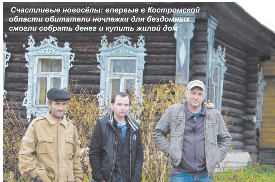
Счастливые новосёлы: впервые в Костромской области обитатели ночлежки для бездомных смогли собрать денег и купить жилой дом