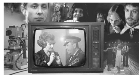
В СССР телевидение иногда было скучным, иногда наивным, но никогда мерзким, как сейчас.