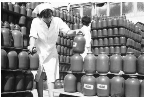
В СССР соки были натуральные и стоили копейки.

Система контроля качества во времена СССР была на высоком уровне. Собственный санитарный контроль в общепите, регулярные проверки специализированных органов, жесткая система наказания сводили к минимуму нарушения. ГОСТ строго соблюдался. Потому конфеты, колбаса или мороженое одного наименования были одинакового вкуса и в Москве, и в Костроме, и во Владивостоке.