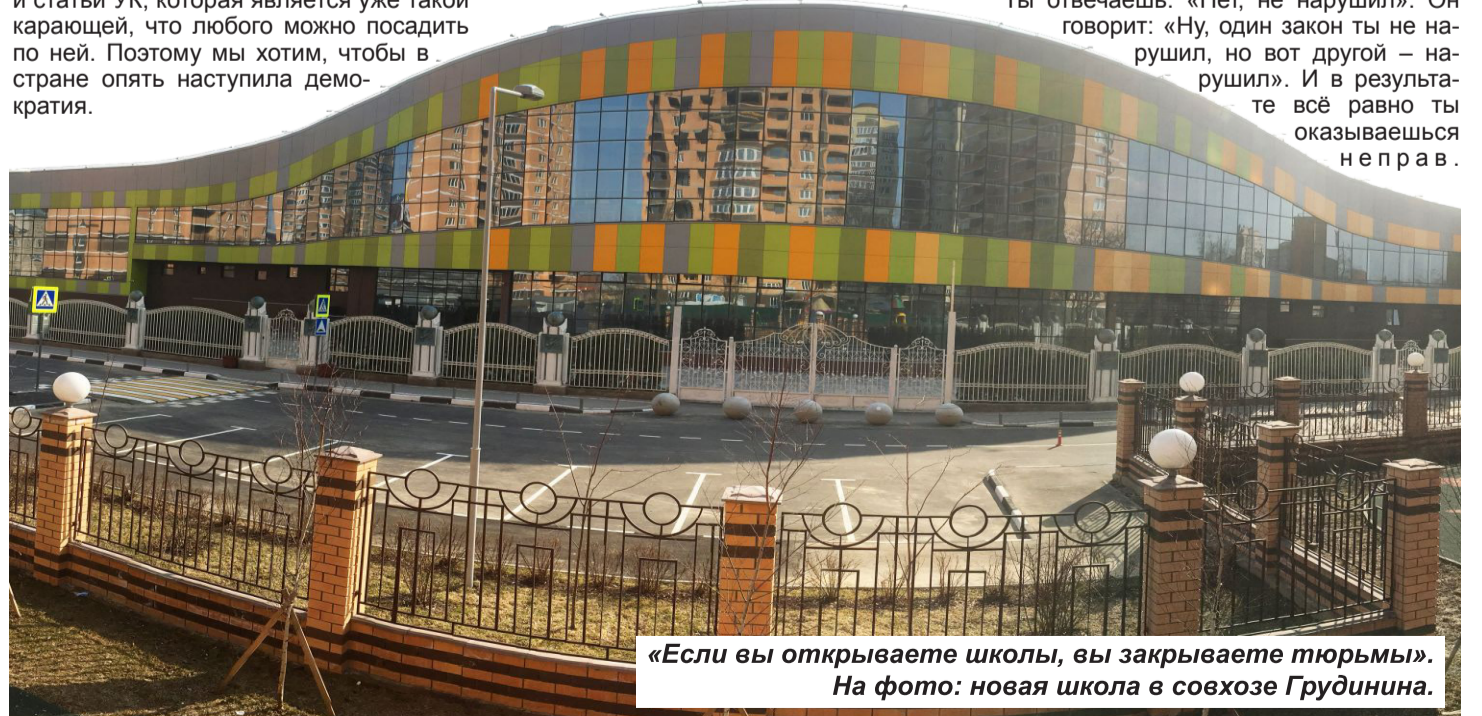
«Если вы открываете школы, вы закрываете тюрьмы». На фото: новая школа в совхозе Грудинина.

Потом, должны быть ясные, чёткие законы. Написано огромное количество нормативных правовых актов – законов, постановлений правительства, разных инструкций, которые друг другу противоречат. Чиновник приходит и говорит: «Слушай, вот ты нарушил этот закон». Ты отвечаешь: «Нет, не нарушил». Он говорит: «Ну, один закон ты не нарушил, но вот другой – нарушил». И в результате всё равно ты оказываешься неправ.