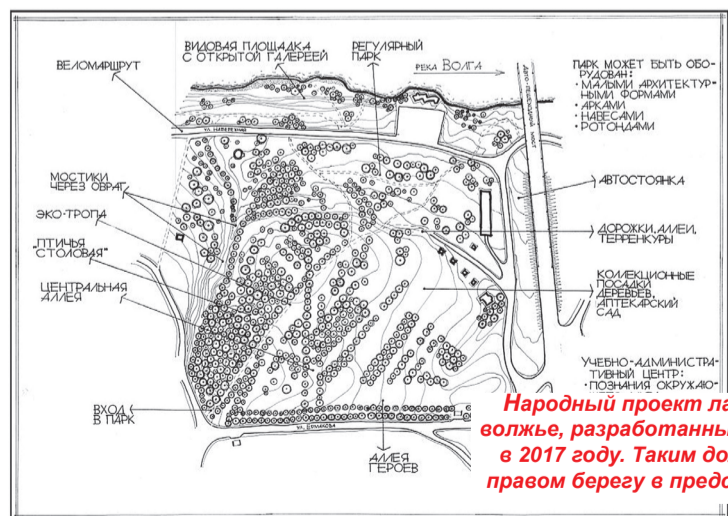
Народный проект ландшафтного парка Заволжье, разработанный инициативной группой в 2017 году. Таким должен был быть парк на правом берегу в представлении костромичей!