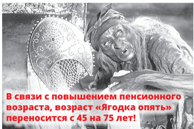
В связи с повышением пенсионного возраста, возраст «Ягодка опять» переносится с 45 на 75 лет!

Дальше – больше. Правительство внесло в Государственную Думу проект закона о пенсионной реформе, согласно которому поэтапно будет увеличиваться пенсионный возраст. Для мужчин с 60 до 65 лет, для женщин – с 55 до 63 лет. Правительство, депутаты от «Единой России» подают это как объективную неизбежность. Продолжительность жизни граждан выросла, да и во всём цивилизованном мире пенсионный возраст выше российского. И здесь проблема не в том, что ранее президент обещал не повышать возраст выхода на пенсию. Он хозяин своего слова: слово дал, слово взял обратно. Главное в другом. Эта рефор-