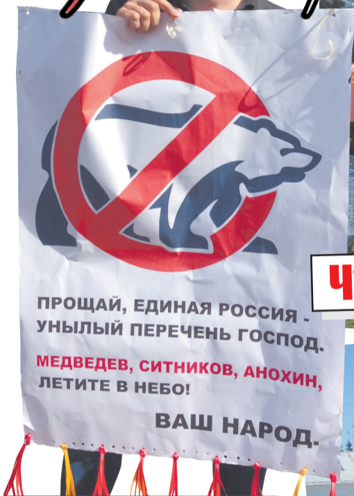
Чухлома - ПРОТИВ!

– Вопреки любым пронкам властей на местах КПРФ будет бороться до конца. Это не пиар акция. Это, если хотите, вопрос жизни всех нас. Поэтому цель только одна: отменить закон единороссов. Наша борьба будет бессрочной, вплоть до победы. Мы не выдохнемся, не сдадимся. Мы выйдем снова и снова. Мы будем бороться за свои права. Прошла только первая акция нашего протеста. 2 сентября будет проходить второй этап Всероссийской акции против повышения пенсионного возраста. Нас ничто не остановит.