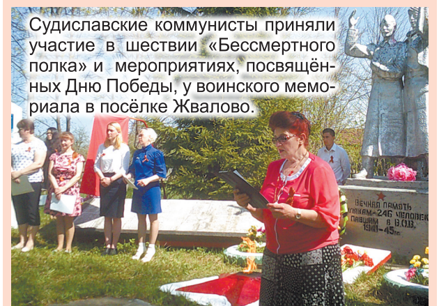
Судиславские коммунисты приняли участие в шествии «Бессмертного полка» и мероприятиях, посвящённых Дню Победы, у воинского мемориала в посёлке Жвалово.