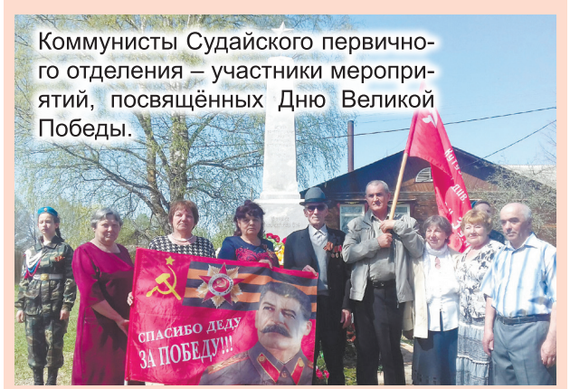
Коммунисты Судайского первичного отделения – участники мероприятий, посвящённых Дню Великой Победы.