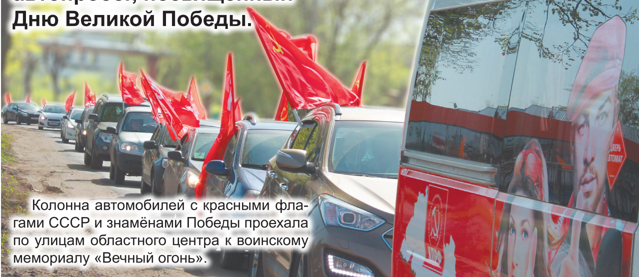
Колонна автомобилей с красными флагами СССР и знамёнами Победы проехала по улицам областного центра к воинскому мемориалу «Вечный огонь».

9 мая коммунисты Костромы провели автопробег, посвящённый Дню Великой Победы.