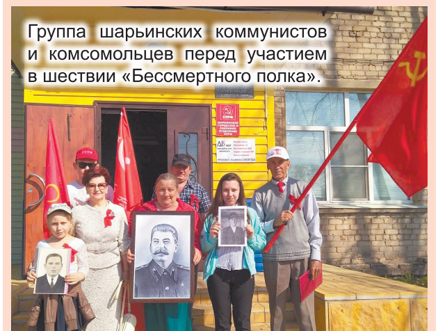
Группа шарьинских коммунистов и комсомольцев перед участием в шествии «Бессмертного полка».