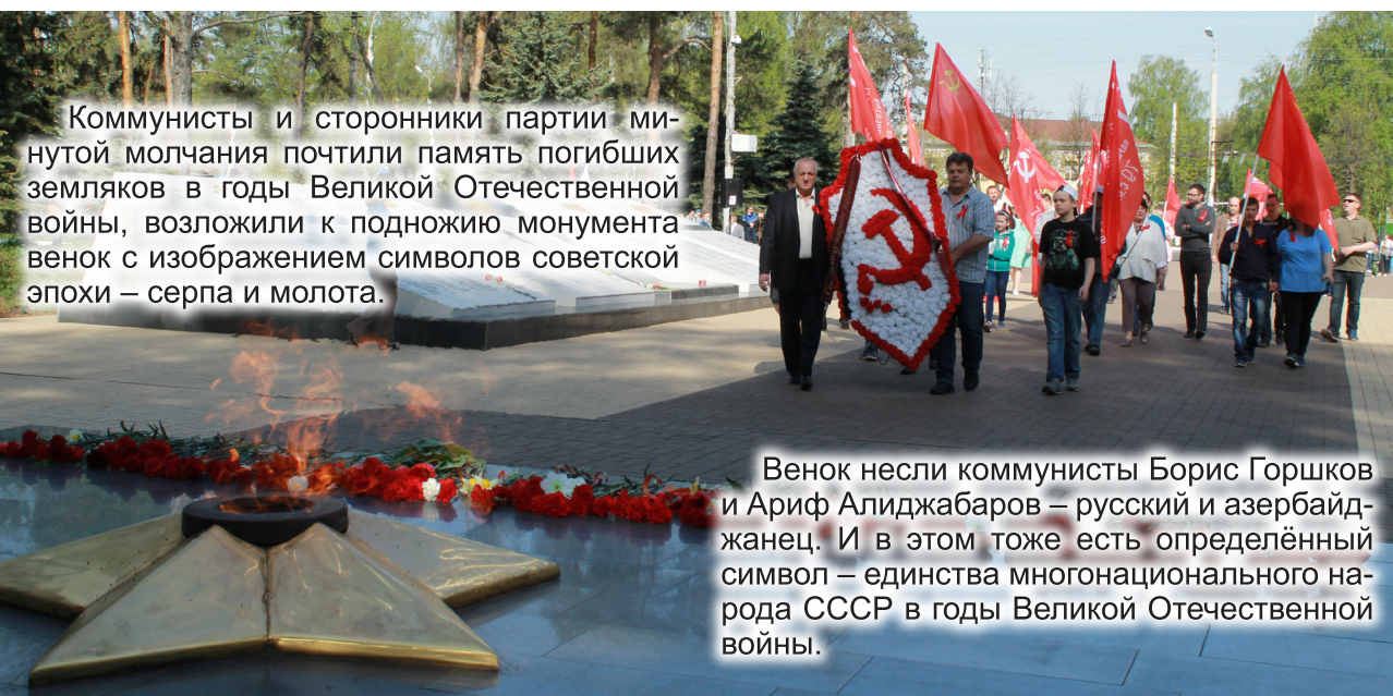
Коммунисты и сторонники партии минутой молчания почтили память погибших земляков в годы Великой Отечественной войны, возложили к подножию монумента венок с изображением символов советской эпохи – серпа и молота.