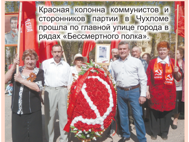
Красная колонна коммунистов и сторонников партии в Чухломе прошла по главной улице города в рядах «Бессмертного полка».