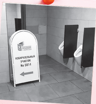
«От голосования просто так не отсидишься!»