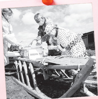
«Голосование на санях – вот это по-русски!»