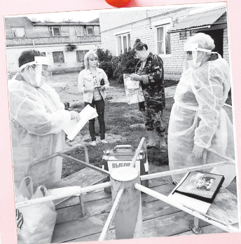
«Так вот ты какая – выборная карусель...»