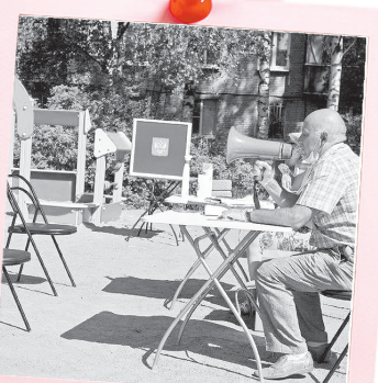
«... и ещё раз для тех, кто спит – просыпаемся, выходим, голосуем...»