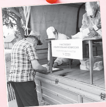
«Нет, ничего не продаём – но всё равно распишитесь!»