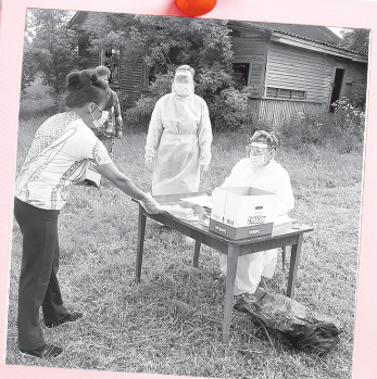
«Главное – соблюдать дистанцию»