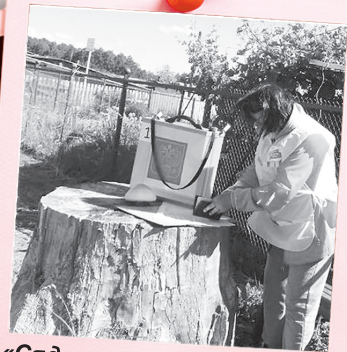
«Сядем на пенёк – обнулим президенту срок!»