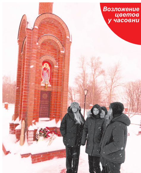
Возложение цветов у часовни

Организаторы мероприятия наградили героев-афганцев памятными медалями, затем было чаепитие с ароматным чаем и сладостями. Завершилась встреча возложением цветов в память о павших воинах, у часовни на территории Собора преподобного Тихона Луховского.