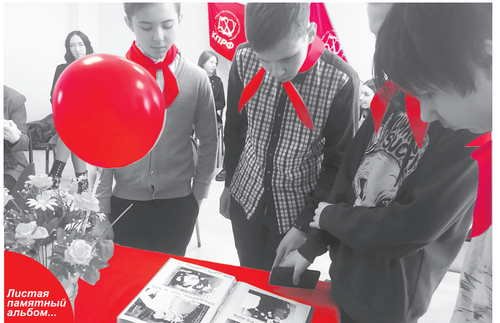
Листая памятный альбом...

Записаться на занятия можно по телефону 51-43-72. Следите за нашими новостями и приходите к нам на учёбу.