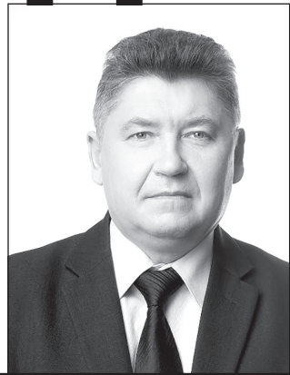
АНОХИН АЛЕКСЕЙ АЛЕКСЕЕВИЧ