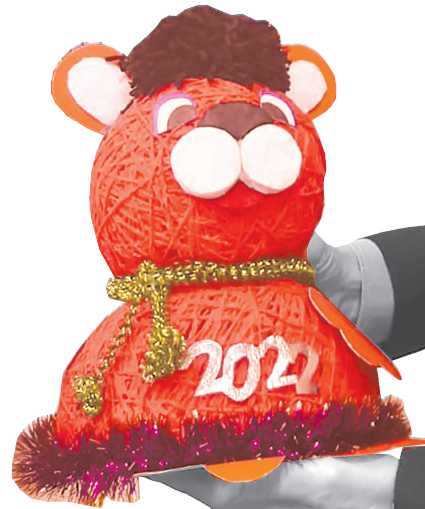
Роман Лябихов помог организовать конкурс детских поделок «Мастерская зимних чудес»

Депутату Госдумы от КПРФ Роману Лябихову были переданы документы – обращения, отписки всевозможных инстанций и другие бумаги.