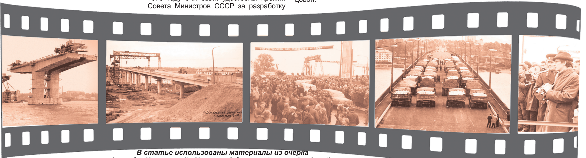
В статье использованы материалы из очерка Зинаиды Николаевой «Мост на будущее: 50-летний юбилей»