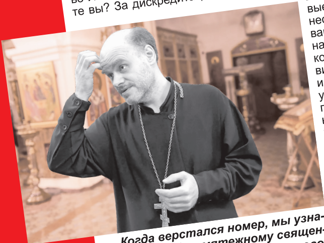
Когда верстался номер, мы узнали, что суд дал мятежному священнику штраф – 35 тыс. руб. Как говорится, по-божески...