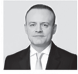
ДАВАНКОВ ВЛАДИСЛАВ АНДРЕЕВИЧ