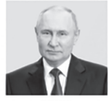
ПУТИН ВЛАДИМИР ВЛАДИМИРОВИЧ