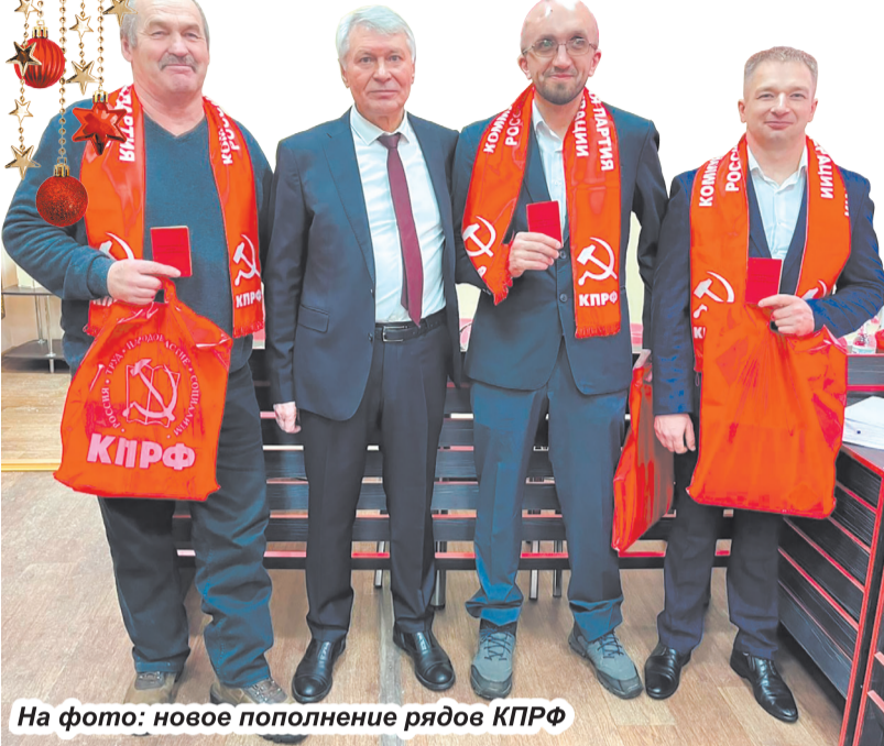
На фото: новое пополнение рядов КПРФ

14 декабря в Костроме проводилась отчётно-выборная Конференция Костромского областного отделения КПРФ.